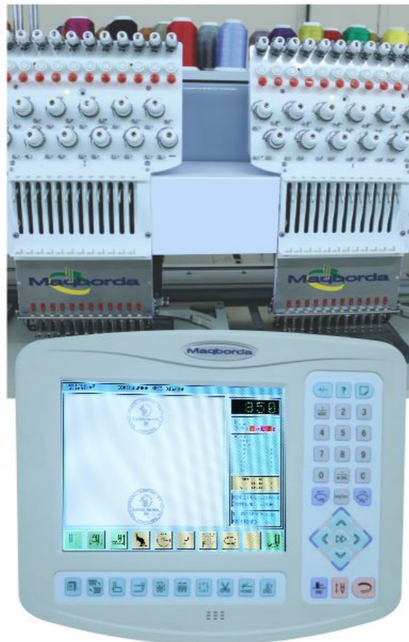
Painel de LCD de fácil manuseio