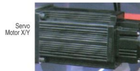
Servo Motor X/Y