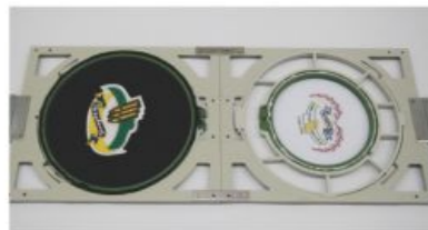
Troca Rápida com Desenhos ou tamanhos diferentes